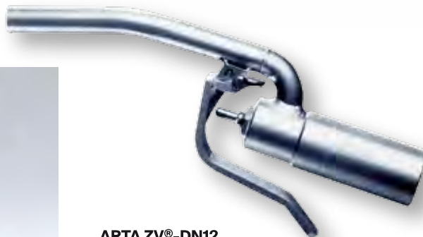
ARTA ZV®-DN12 Кран с ручным управлением от ARTA